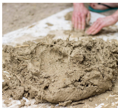
CONOSCIAMO LA TERRA