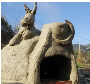
AUTOCOSTRUIAMO IL FORNO IN TERRA